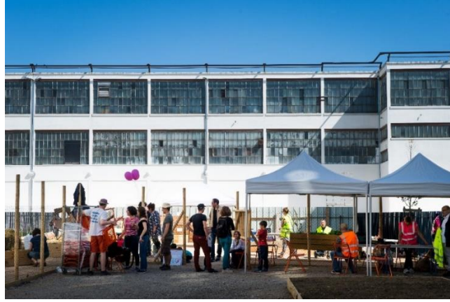
Les rencontres du Carré de Soie - Visites