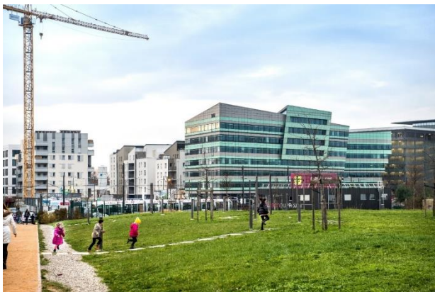
Le Carré de Soie, un quartier vivant en devenir...

Enfin, l'aspect santé a été peu intégré aux questions d'économie circulaire. Nous constatons une demande émergente de la part des conseils de quartier, mais nous manquons de moyens humains pour y répondre ... Un futur chantier peut-être ?