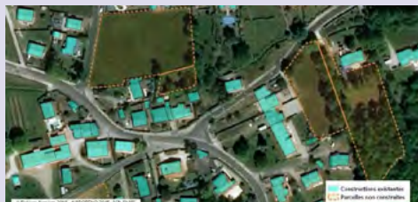
Une méthode du Cerema pour identifier et caractériser le foncier mutable en Gironde à l'aide des fichiers fonciers.

Le rassemblement de toutes ces informations peut s'effectuer ponctuellement. Cependant, la constitution d'un observatoire du foncier à l'échelle de l'intercommunalité ou du Schéma de cohérence territoriale – voire sur un territoire plus large – est une étape incontournable. L'observation pérenne permettra d'adapter les actions à mener au fil du temps.