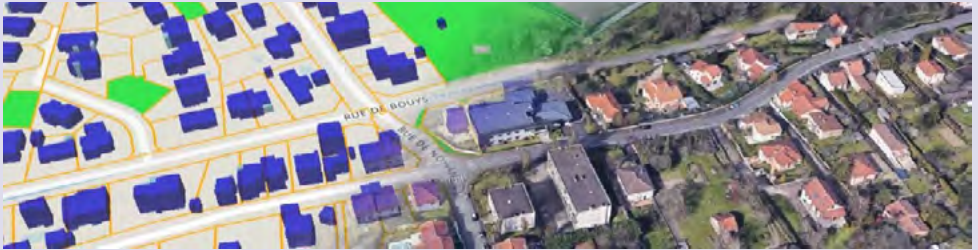
L'outil UrbanSIMUL pour une simulation de stratégie d'aménagement basée sur l'utilisation des données foncières et immobilières.

En croisant la connaissance des gisements fonciers et immobiliers dans le temps et les leviers d'actions possibles, la stratégie foncière permettra de définir un cap, un calendrier et un plan d'action. Dans un contexte de sobriété foncière et de préservation des sols, il s'agira de déterminer quelles actions réaliser prioritairement pour limiter le recours aux extensions urbaines, privilégier les projets dans la trame urbaine existante, et réaliser des opérations d'aménagement plus vertueuses. Par la suite, la mise en place d'une veille foncière permettra de réajuster la stratégie en fonction des évolutions du territoire et de saisir les opportunités nouvelles.