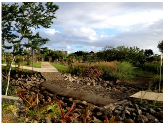
Parc Urbain de la Ravine Blanche

Afin de favoriser la diversification de l'offre commerciale et la dynamisation du quartier, l'opérateur a aussi proposé l'accompagnement des porteurs de projets et la promotion du territoire. La Chambre de Commerce et d'Industrie (CCI) de La Réunion a mis en place un guichet unique pour s'occuper des porteurs de projets locaux, facilitant l'émergence de nouvelles activités et la diversité dans l'offre commerciale du quartier.