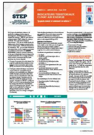
Indicateurs territoriaux climat-air-énergie : lesquels choisir et comment les utiliser ? STEP N°4 – janvier 2020