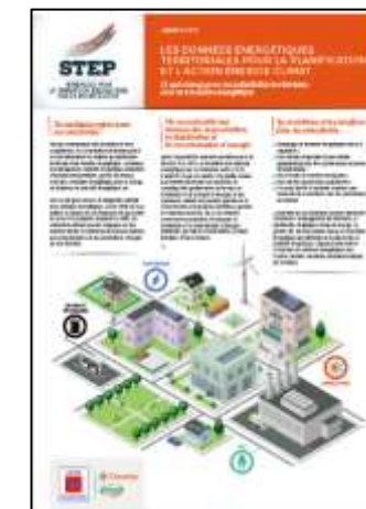
Données énergétiques territoriales pour la planification et l'action énergie-climat. STEP N°1 – janvier 2017