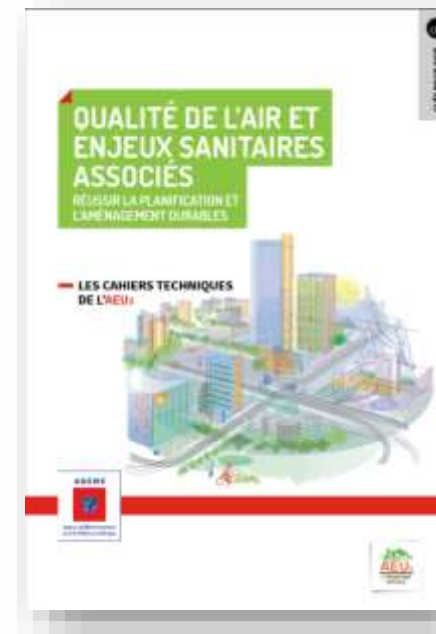
La qualité de l'air et ses enjeux sanitaires associés