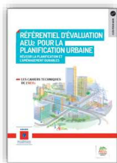
Référentiel d'évaluation pour la planification urbaine