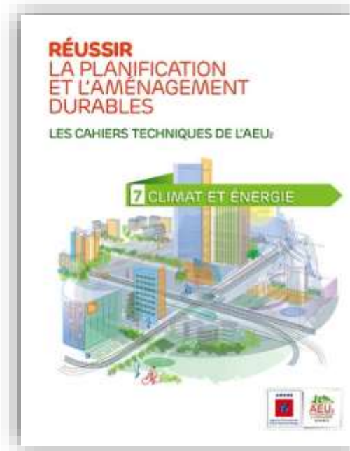
L'énergie et le climat