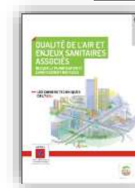
Qualité de l'air et enjeux sanitaires associés