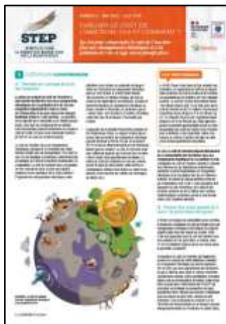
Evaluer le coût de l'inaction : oui et comment ? STEP N°5 – mai 2022