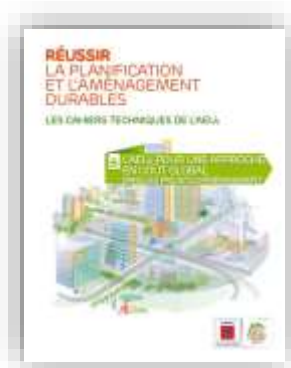
Approche en coût global dans les projets d'aménagement