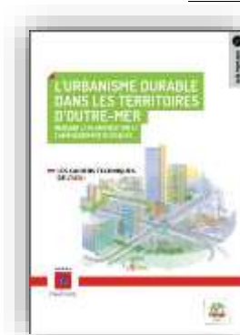
L'urbanisme durable dans les territoires d'Outre Mer