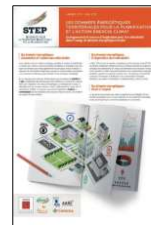
Données énergétiques territoriales pour la planification et l'action Energie-Climat-suite. STEP N°2 – janvier 2018