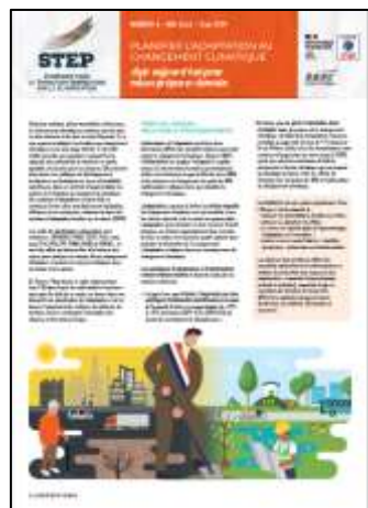
Planifier l'adaptation au changement climatique : agir aujourd'hui pour mieux préparer demain. STEP N°6 – mai 2023