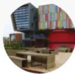
ÉCONOMIE CIRCULAIRE ET URBANISME