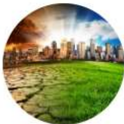
RECHERCHE ET DÉVELOPPEMENT