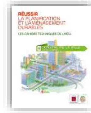
Construire la ville sur elle-même