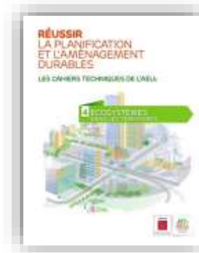
Ecosystèmes dans les territoires