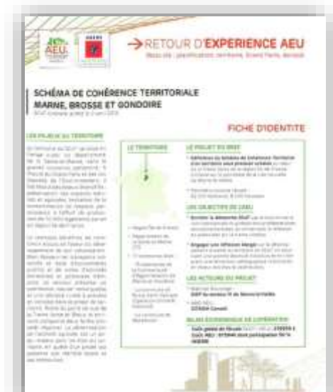
SCoT Marne Brosse et Gondoire