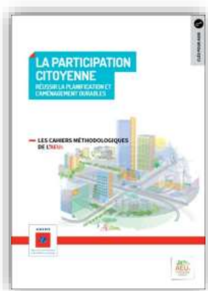
La participation citoyenne