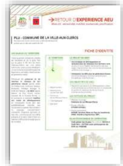
PLU – Commune de la Ville-aux-Clercs