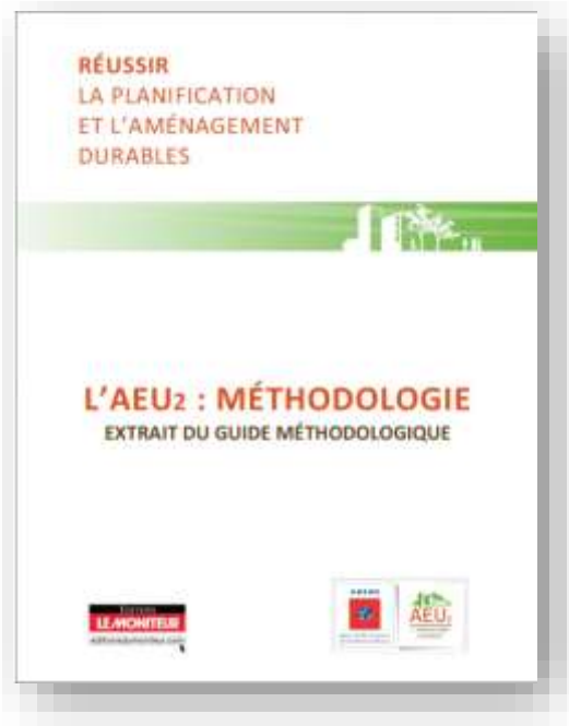
L'AEU2 : Méthodologie