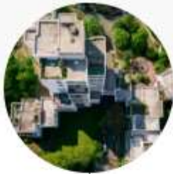
QUARTIERS ÉNERGIE CARBONE