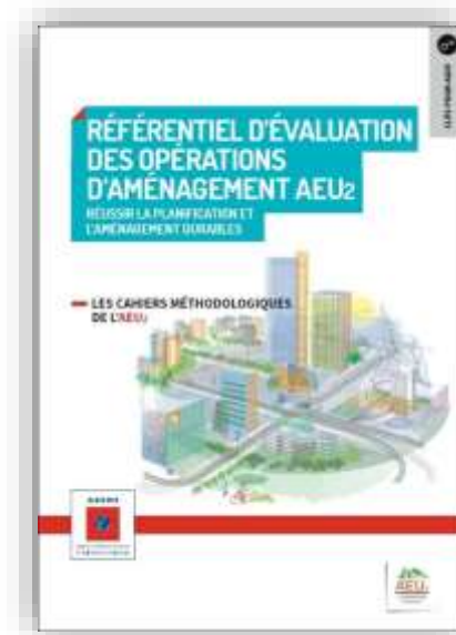
Référentiel d'évaluation des opérations d'aménagement