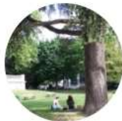
SANTÉ, INCLUSION ET BIEN-ÊTRE