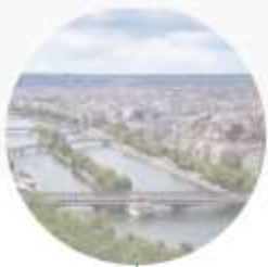
PLANIFICATION BAS CARBONE