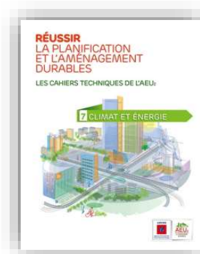
Climat et énergie