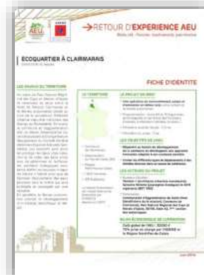
Ecoquartier à Clairmarais