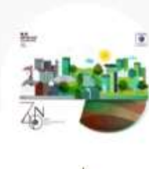
TERRITOIRES ZÉRO ARTIFICIALISATION NETTE