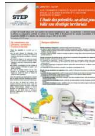
Données énergétiques territoriales pour la planification et l'action Energie-Climat STEP N°3 – janvier 2019