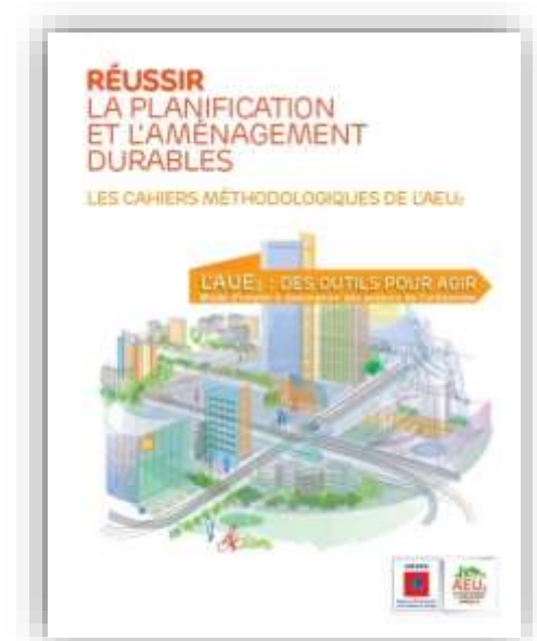
L'AEU2 : Des outils pour agir