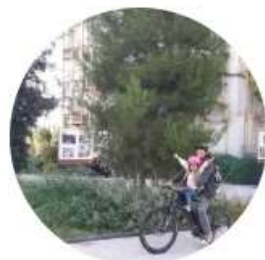
EXPÉ URBA SANTÉ