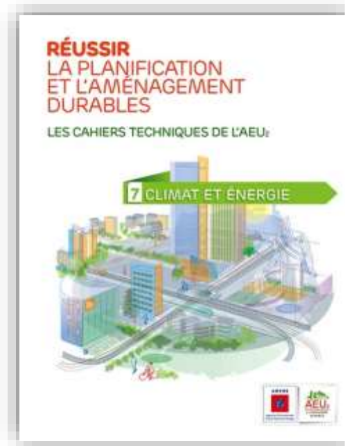
L'énergie et le climat