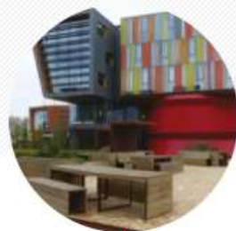
ÉCONOMIE CIRCULAIRE ET URBANISME