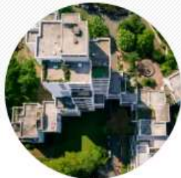
QUARTIERS ÉNERGIE CARBONE