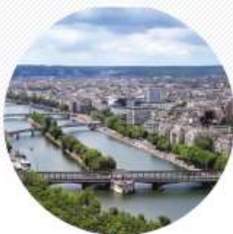
PLANIFICATION BAS CARBONE