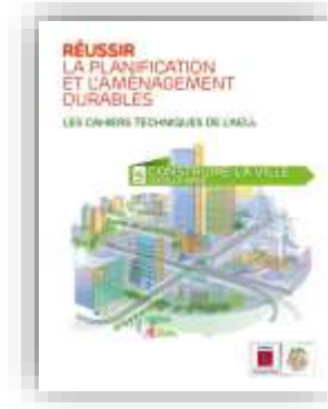
Construire la ville sur elle-même