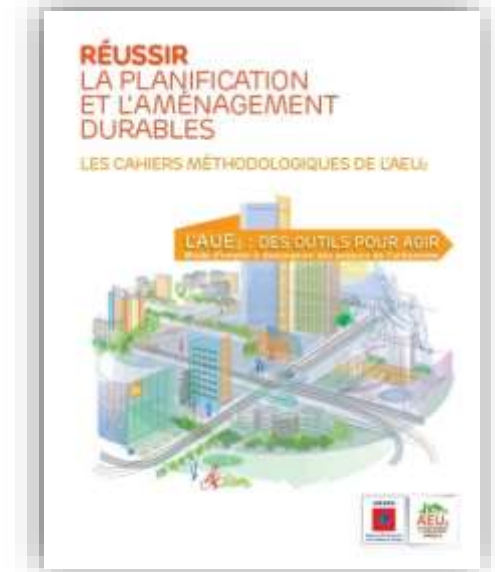
L'AEU2 : Des outils pour agir