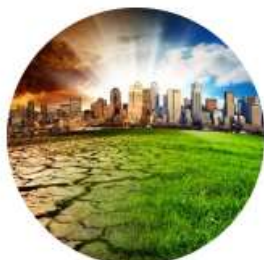
RECHERCHE ET DÉVELOPPEMENT