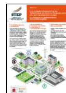
Planifier l'adaptation au changement climatique : agir aujourd'hui pour mieux préparer demain. STEP N°6 - mai 2023