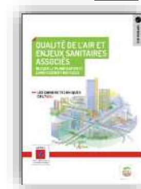
Qualité de l'air et enjeux sanitaires associés