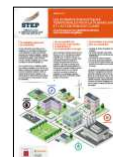
Planifier l'adaptation au changement climatique : agir aujourd'hui pour mieux préparer demain. STEP N°6 – mai 2023