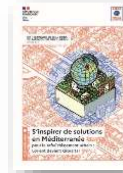
S'inspirer cahier 3