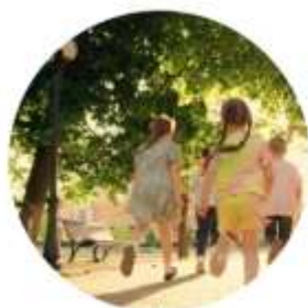
EXPÉ URBA SANTÉ