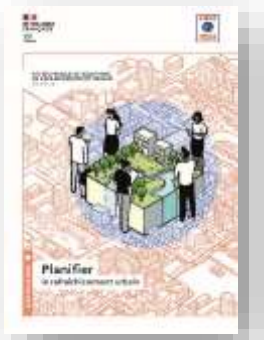
Planifier cahier 1

Le kit technique de solutions de rafraîchissement urbain Face à l'augmentation de la durée, de l'intensité et de la fréquence des canicules, le rafraîchissement urbain est un impératif pour l'adaptation des villes au changement climatique. Pour le mettre en œuvre, il est indispensable d'acquies une vision stratégique qui dépasse l'expérimentation. À cette fin, le kit technique de solutions de rafraîchissement urbain offre des connaissances techniques et méthodologiques. Prolongeant le kit, le présent document présente les contenus des trois cahiers composant le kit et propose la notion de « droit à la fraîcheur ». ➔