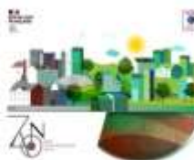
TERRITOIRES ZÉRO ARTIFICIALISATION NETTE