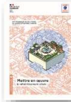
Mettre en œuvre cahier 2