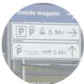
SOBRIÉTÉ ET URBANISME COMMERCIAL