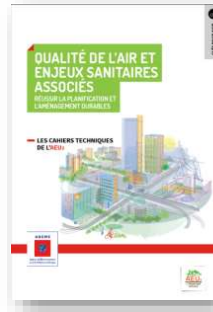
La qualité de l'air et ses enjeux sanitaires associés