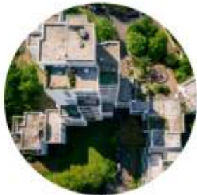
QUARTIERS ÉNERGIE CARBONE