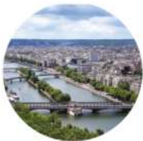
PLANIFICATION BAS CARBONE