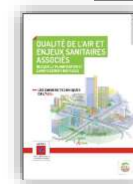
Qualité de l'air et enjeux sanitaires associés