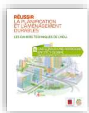
Approche en coût global dans les projets d'aménagement