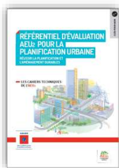
Référentiel d'évaluation pour la planification urbaine