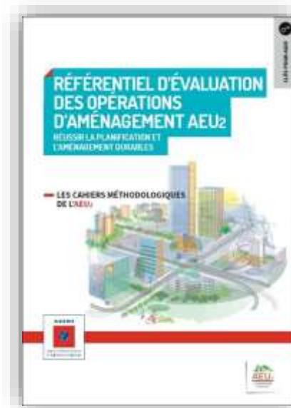
Référentiel d'évaluation des opérations d'aménagement