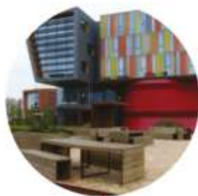
ÉCONOMIE CIRCULAIRE ET URBANISME