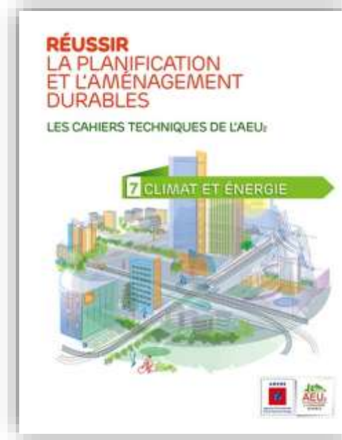
L'énergie et le climat